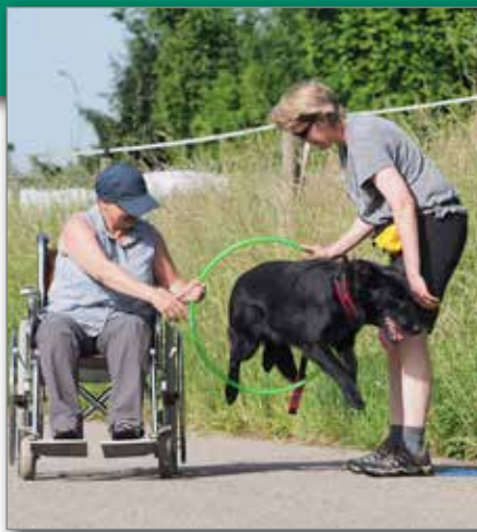
Der Hund zeigt an der Jahresüberprüfung eine einsatztaugliche Handlung. (Archivfoto)

Ob der Mensch seinen Hund umsichtig führt und nicht den Hund führen lässt, zeigt sich in der Übung «Begegnung mit anderen Hunden». Hier sollen sich die angeleiteten Hunde ohne gegenseitige Belästigung, ohne Spielaufforderung, ohne Bellen oder Aggressionsverhalten neben ihrem Menschen in der grossen Gruppe bewegen.